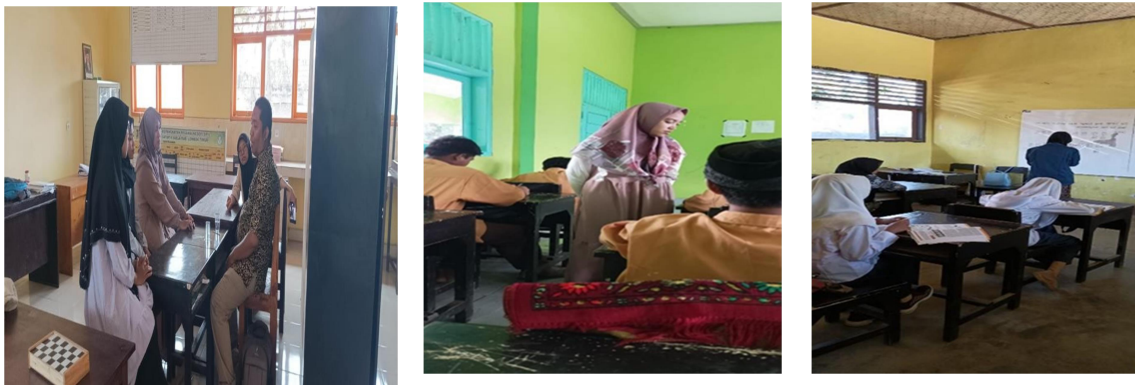
Diskusi persiapan mengajar

yang masih belum bisa membaca dan menulis kemampuan literasi dan munerasinya mulai mengalami peningkatan. Selain berdampak bagi siswa, program Pembelajaran Aktif dan Menyenangkan ini juga berdampak bagi guru, yaitu sebagai referensi dalam menerapkan berbagai media pembelajaran yang akan digunakan disesuaikan dengan kebutuhan siswa.