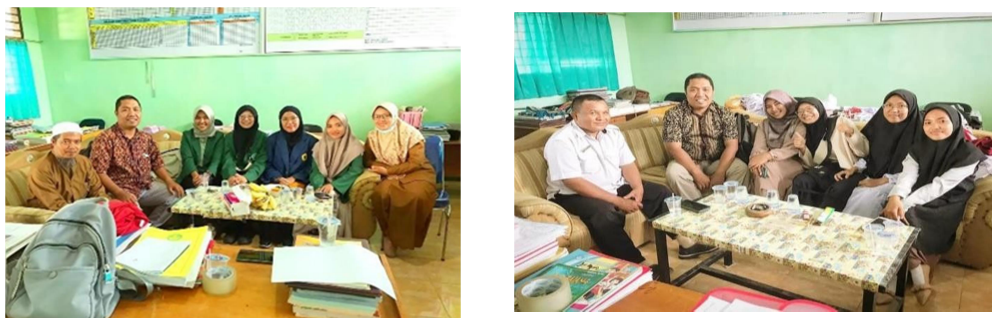
Gambar 4. Diskusi Administrasi Sekolah

Analisis program adaptasi teknologi di SMPN SATAP 4 SUELA telah sesuai yaitu siswa dapat mengoperasikan teknologi khususnya laptop. Siswa sudah bisa mengoperasikan laptop dan aplikasi-aplikasi di dalamnya yang berguna dalam pembelajaran dan sebagainya. Dampaknya siswa menjadi lebih melek teknologi, selain bisa mengoperasikan handphone siswa juga bisa mengoperasikan laptop yang akan berguna di jenjang pendidikan selanjutnya.