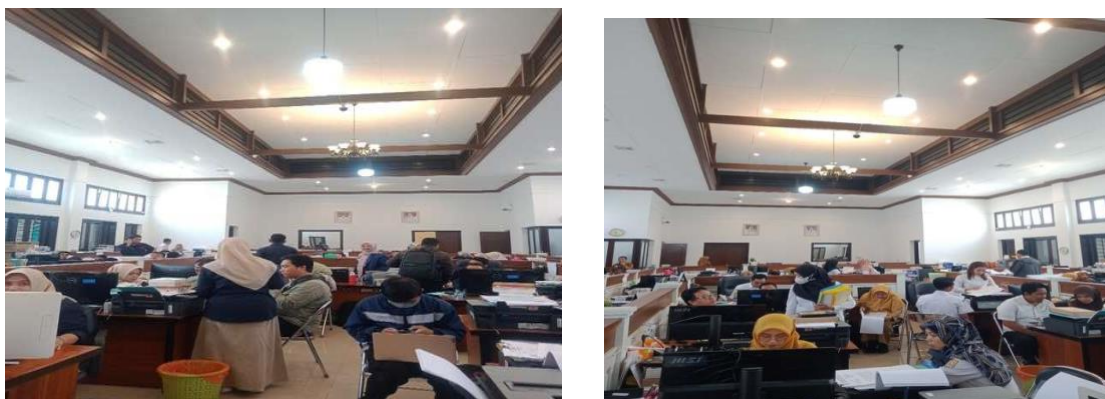
Gambar 1. Foto dokumentasi pengabdian