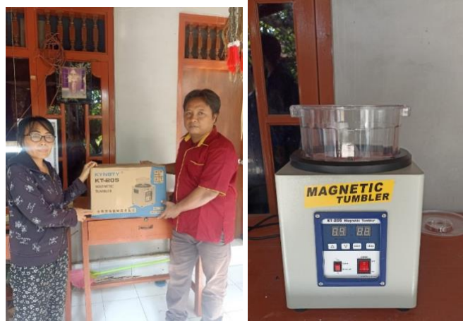
Gambar. 3 Penyerahan Mesin Tumbler Magnetik