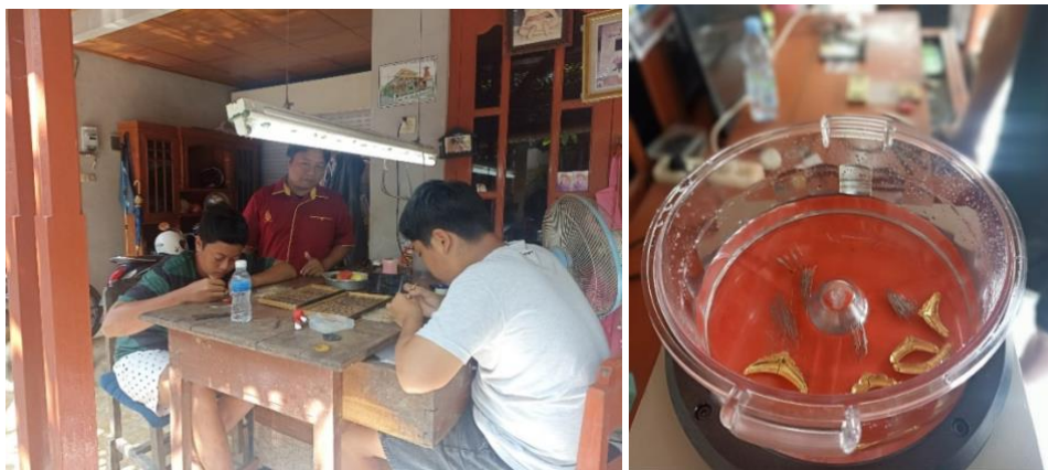
Gambar. 6 Peragaan Pencucian Emas

Berdasarkan uraian kegiatan diatas, secara keseluruhan kegiatan ini berjalan dengan sangat baik. Kegiatan ini juga akan berlangsung pada tahap berikutnya yaitu pembuatan brandbook untuk Suranti Gold. Adapun dokumentasi seluruh team adalah sebagai berikut.