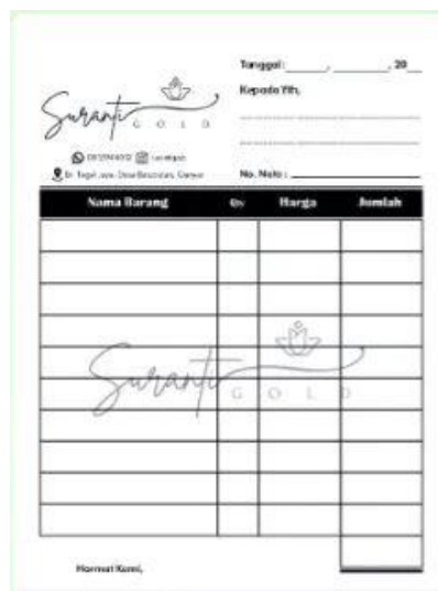
Gambar. 4 Nota Keuangan Mitra

Untuk memperbaiki manajemen keuangan yang selama ini tidak tercatat dengan baik, mitra dalam kegiatan pengabdian ini diberikan nota keuangan. Nota keuangan yang diberikan sesuai dengan desain logo Surianti Gold terbaru serta terdapat nama dan kontak dari Surianti Gold. Nota ini diharapkan dapat mempermudah pencatatan keuangan.