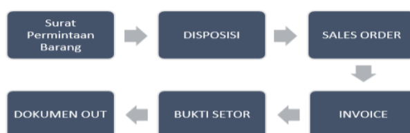
Diagram 2. Urutan arsip dokumen

Pertama adalah pengarsipan dokumen KPSH. Kepanjangan KPSH sendiri yaitu Ketersediaan Pasokan dan Stabilisasi Harga. Tahapan pengarsipan dokumen KPSH yang dilakukan penulis selama magang di kantor Perum BULOG Kanwil Yogyakarta yang ditempatkan pada divisi Operasional dan Pelayanan Publik khususnya di Seksi Pelayanan Publik yang tupoksinya sebagai seksi penyaluran beras CBP (Cadangan Beras Pemerintah) atau sering disebut beras PSO ( public service obligation ). Penulis ditugaskan untuk mengarsip dokumen hard copy dari program KPSH yaitu produknya berupa Beras Medium 20%. (Iskandar Yahya Arulampalam Kunaraj P.Chelvanathan, 2023) Berikut urutan dalam mengarsip dokumen KPSH dapat dilihat pada diagram 2.