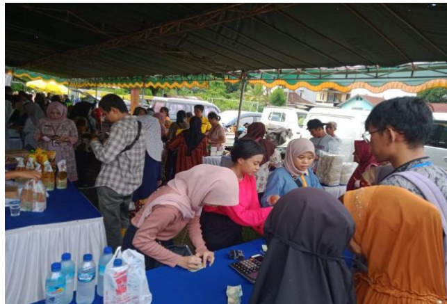
Gambar 2. Dokumentasi operasi pasar

2024). Tujuan utama dari operasi pasar ini adalah untuk menjaga stabilitas harga, memastikan ketersediaan bahan pangan bagi masyarakat, serta menghindari lonjakan harga yang dapat merugikan konsumen, terutama mereka yang berpenghasilan rendah.