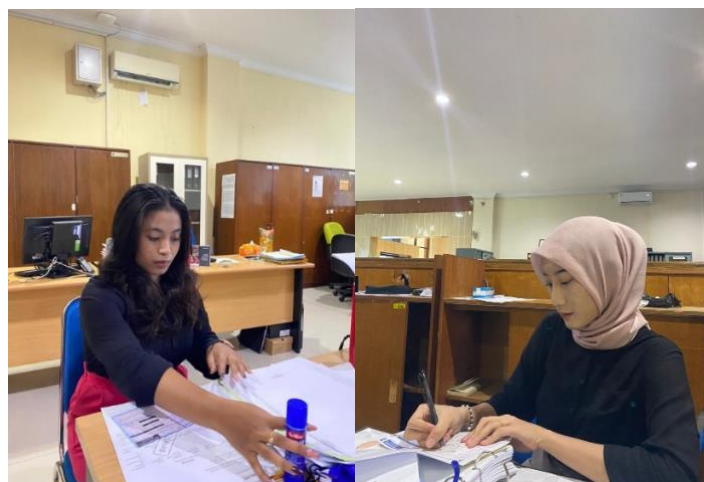
Gambar 1. Dokumentasi Arsip Dokumen

Kedua adalah kegiatan operasi pasar murah. Operasi pasar yang dilakukan oleh Badan Urusan Logistik (Bulog) merupakan langkah intervensi pemerintah untuk mengendalikan harga kebutuhan pokok, terutama beras, di pasaran (Fakulta & Juliansyah,