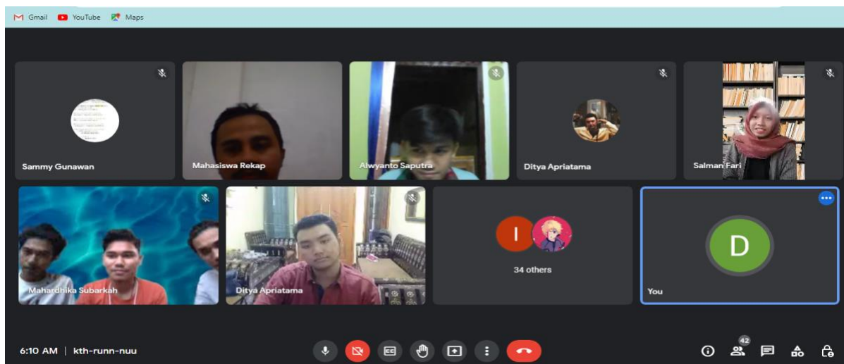
Gambar 1. Penyampaian tujuan kegiatan pelatihan melalui Google-meets