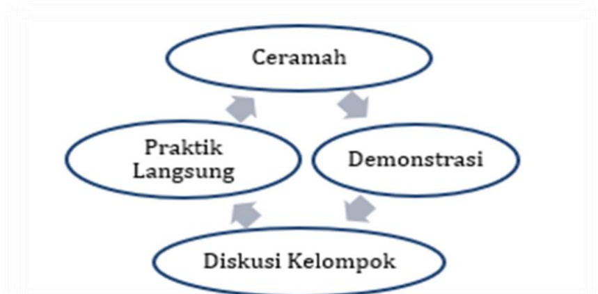
Gambar 1. Metode pelaksanaan kegiatan PkM

demonstrasi, diskusi kelompok, dan praktik langsung. Metode ini dipilih agar mahasiswa dapat memahami materi secara komprehensif dan mampu mengaplikasikan pengetahuan yang telah diperoleh dalam penulisan KTI mereka. Pelaksanaan Pengabdian kepada Masyarakat (PkM) ini terdiri dari beberapa tahapan yang dirancang untuk memastikan pelatihan berjalan efektif dan mencapai tujuan yang telah ditetapkan.