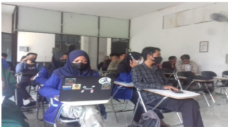
Gambar 3. Praktik penulisan sitasi dan daftar pustakan manual dan bimbingan