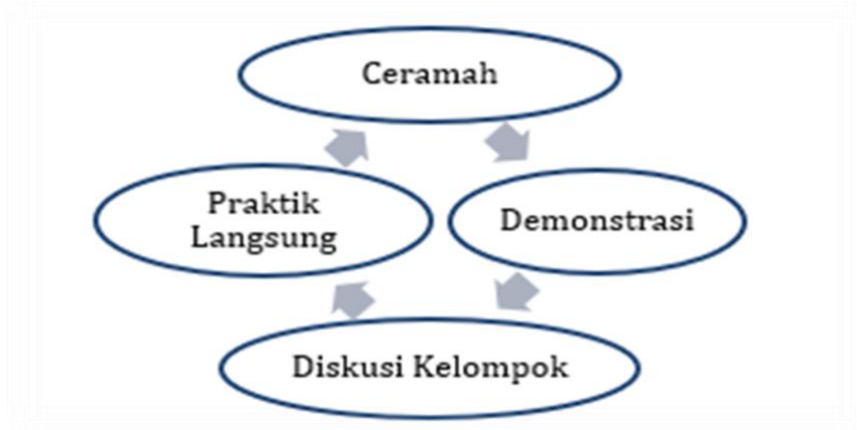
Gambar 1. Metode pelaksanaan kegiatan PkM

dapat memahami materi secara komprehensif dan mampu mengaplikasikan pengetahuan yang telah diperoleh dalam penulisan KTI mereka. Pelaksanaan Pengabdian kepada Masyarakat (PkM) ini terdiri dari beberapa tahapan yang dirancang untuk memastikan pelatihan berjalan efektif dan mencapai tujuan yang telah ditetapkan.