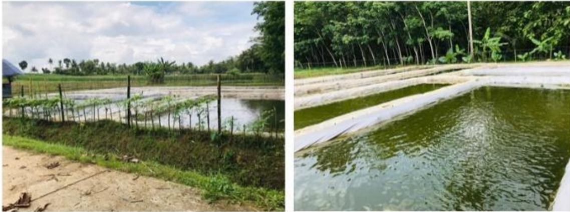
Gambar 1. Profil kolam ikan Kelompok Pembudidaya Ikan Tirta Lestari Plana.

profil singkat kelompok tersebut beserta kondisi kolam ikan yang dikelola kelompok bentukan Pemerintah Desa Plana.