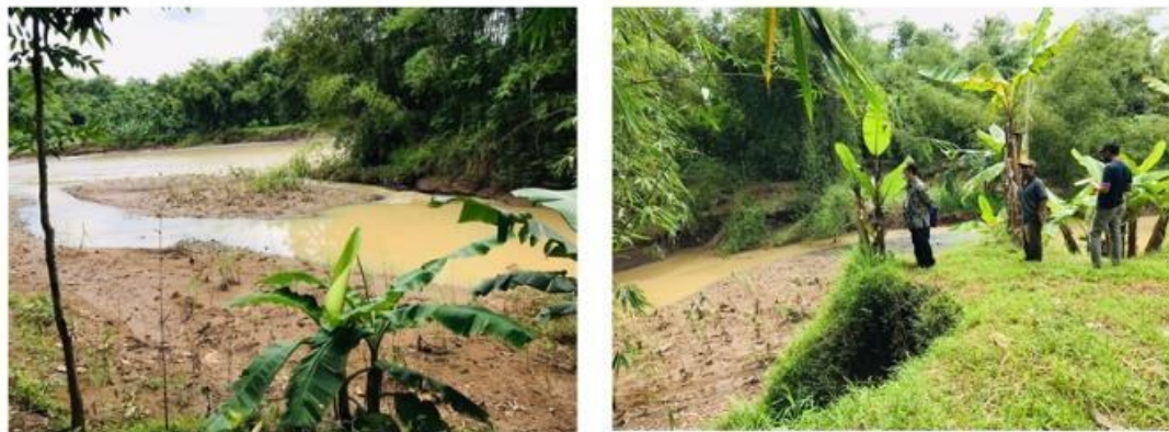
Gambar 2. Sumber aliran air dari Sungai Serayu.

Setelah mempertimbangkan permasalahan yang dihadapi kelompok tersebut maka direncanakan sebuah kegiatan alih teknologi berupa pompa air yang tenaga penggerakya berupa kincir yang didorong aliran sungai. Kegiatan akan dilaksanakan dalam bentuk sosialisasi cara pembuatan pompa dengan menerapkan hasil penelitian dan pengabdian yang telah dilaksanakan di Jurusan Fisika FMIPA Unsoed (Aminuddin dkk 2019a,b). Kegiatan ini akan dilaksanakan dengan menganalisa kemampuan kondisi aliran Sungai Serayu yang akan digunakan sebagai sumber air dan sumber gaya dorong untuk memutar kincir. Gaya dorong tersebut akan dikaji ulang keseimbangannya untuk memutar kincir dan konverter energi yang terdiri atas beberapa roda. Konverter energi merupakan bagian penting pada pompa untuk mengubah energi aliran sungai menjadi energi mekanik untuk memutar kincir sebagai tenaga penggerak pompa (Aminuddin dkk 2020a,b). Kegiatan ini bertujuan untuk mentransformasi teknologi sederhana kepada Kelompok Pembudidaya Ikan Tirta Mandiri Plana. Setelah kegiatan ini, kelompok tersebut diharapkan mampu merawat dan mengembangkan pompa air dengan kincir sebagai tenaga penggerak.