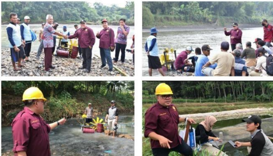
Gambar 4. Pompa air dengan kincir sebagai tenaga penggerak yang telah dimanfaatkan kelompok pembudidaya ikan Tirta Lestari Plana.

Pompa air ini telah diuji pada aliran air dengan gaya dorong yang relatif rendah sampai tinggi dengan debit air 0,05-0,09 Liter/sekon. Debit air tersebut tampak masih sangat rendah jika dibandingkan dengan debit yang dihasilkan pompa air dengan tenaga mesin dan tenaga listrik dengan perbandingan sampai 24 kali. Pompa air ini dapat bekerja secara terus menerus sehingga dibutuhkan waktu 24 jam untuk mengangkat air dengan volume yang sama dengan pompa mesin selama 1 jam. Secara teknis, pompa air yang telah direalisasikan dalam kegiatan ini lebih memudahkan karena desainnya sederhana dan dapat dibuat dari bahan bekas yang masih layak pakai. Secara ekonomis, pompa ini juga lebih menguntungkan bagi mitra dalam kegiatan ini, karena tidak membutuhkan biaya tambahan khususnya pengadaan bahan bakar mesin.