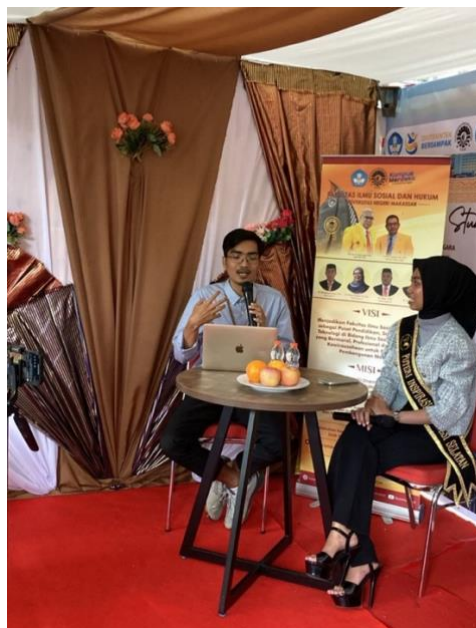
Gambar 2. Kegiatan Minitalkshow

Dalam sesi utama, moderator memulai sesi minitalkshow dengan memberikan gambaran mengenai fenomena orang muda dan sociopreneurship (Gambar 1) dan mempersilahkan narasumber memberikan perspektifnya. Narasumber membuka dengan memberikan penegasan secara tidak langsung bahwa sociopreneurship tidak berhenti pada wacana filantropi, melainkan diwujudkan dalam bentuk tindakan nyata yang berdampak. Salah satu contoh konkret ditunjukkan yakni melalui kegiatan Himanis Mengabdi yang pernah dijalankan. Disebutkan bahwa kegiatan tersebut terdiri dari tiga batch dengan tema pendampingan berbeda-beda yaitu: (1) Growth Mindset , untuk memperkuat pola pikir kewirausahaan, (2) Legalitas Usaha, untuk membantu pelaku usaha kecil memahami pentingnya izin usaha dan perlindungan hukum, serta (3) Desain Grafis, untuk memperkuat kemampuan promosi dan branding produk melalui teknologi digital. Lebih lanjut dijelaskan bahwa proses pendampingan yang telah dilakukan tersebut disebutkan sebagai bentuk aktualisasi keilmuan Administrasi Bisnis dalam konteks nyata masyarakat, khususnya pada aspek pemberdayaan ekonomi lokal. Capaian dari kegiatan tersebut berupa empat usaha kecil yang berhasil memperoleh legalitas usaha serta dua peserta yang berhasil memiliki desain grafis usahanya sendiri.