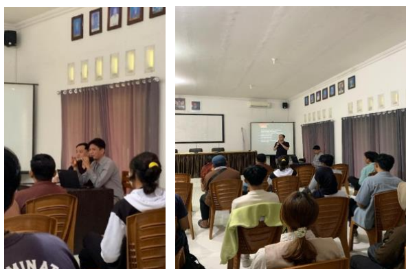
Gambar 2. Foto dokumentasi pengabdian

Program penjangkauan masyarakat yang berfokus pada pengembangan desain kemasan bagi UMKM ini dilaksanakan sebagai sarana untuk meningkatkan penjualan produk lokal di pasar yang semakin kompetitif. Kegiatan ini bertujuan untuk mengatasi permasalahan umum yang dihadapi para peserta UMKM, yang umumnya informatif, menarik, dan sejalan dengan standar pemasaran kontemporer. Melalui riset yang intensif, UMKM bertujuan untuk memahami bahwa kemasan bukanlah tanda kelemahan, melainkan komponen penting dari strategi branding yang memengaruhi minat beli konsumen.