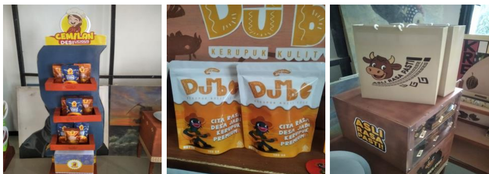
Gambar3. Hasil praktik pendampingan brand dan kemasan

meningkatkan daya saing dan nilai tambah produk lokal. Di tengah persaingan pasar yang semakin ketat, identitas merek yang kuat mencakup logo, palet warna, dan filosofi merek berfungsi sebagai pembeda utama dan fondasi untuk membangun kepercayaan konsumen. Adanya identitas merek yang profesional dan konsisten terbukti membantu UMKM membedakan diri dari kompetitor dan membangun loyalitas pelanggan jangka panjang (Nazhif & Nugraha, 2023). Tanpa identitas yang jelas, produk UMKM berisiko dianggap generik dan kesulitan menembus pasar yang lebih luas.