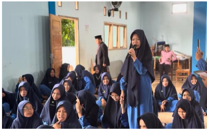
Gambar 3. Diskusi siswa-siswi dengan pemateri

Pelaksanaan kegiatan Pengabdian masyarakat ini memperlihatkan hasil yang positif di mana siswa-siswi mulai memahami tentang pentingnya keselamatan berkendara bagi pelajar dalam tujuan menekan tingginya pelanggaran lalu lintas berupa tindakan bonceng tiga. Akan tetapi pemahaman ini harus di dukung dengan kesadaran dari setiap individu baik pelajar maupun pengguna jalan lainnya. Dilihat dari manfaatnya kegiatan pengabdian masyarakat di Pondok Pesantren Tahfidz Quran Miftahul Jannah Bandar Lampung efektif memberikan pemahaman baru kepada siswa-siswi terhadap keselamatan berkendara dalam lalu lintas. pelajar mampu mengenali regulasi hukum tentang fenomena bonceng tiga, teknis penindakan hukumnya, dan tahapan persidangan tilang dimana pelajar dapat memahami akan pentingnya keselamatan berkendara yang merupakan prioritas utama di jalan raya.