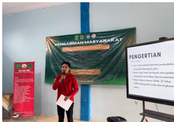
Gambar 1. Pemberian materi pengertian Lalu lintas dan keselamatan berkendara

karena informasi dan akses hukum yang jarang mereka temui. Seperti yang kita ketahui bahwa kendaraan bermotor merupakan alat penunjang akses pendidikan dan hal tersebut harus berjalan beriringan dengan pemahaman pelajar akan pentingnya keselamatan dalam lalu lintas. Pelajar dalam hal ini siswa-siswi wajib untuk memahami lebih detail tentang segala sesuatu yang berkaitan dengan keselamatan berkendara karena mereka harus bisa mengambil keputusan yang benar dalam berkendara seperti tidak melakukan tindakan yang dapat merugikan diri mereka dan pengendara lainnya di jalan raya. Kendaraan bermotor memungkinkan siswa yang tinggal di daerah dengan jarak tempuh jauh atau akses transportasi umum terbatas untuk tetap dapat mengakses pendidikan secara konsisten, sehingga mengurangi angka ketidakhadiran dan potensi putus sekolah di kalangan pelajar.